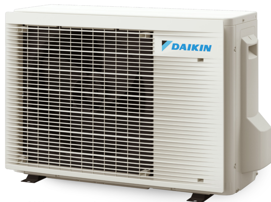
RXJ20-25-35A 552,7 x 840 x 350 mm